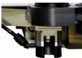
Plastic depth limiter S103