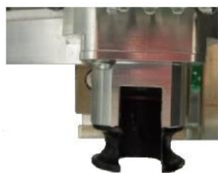
Plastic depth limiter S63