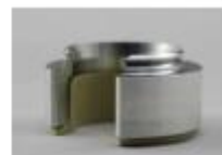
10041281 Air cushion foot aluminum for S103