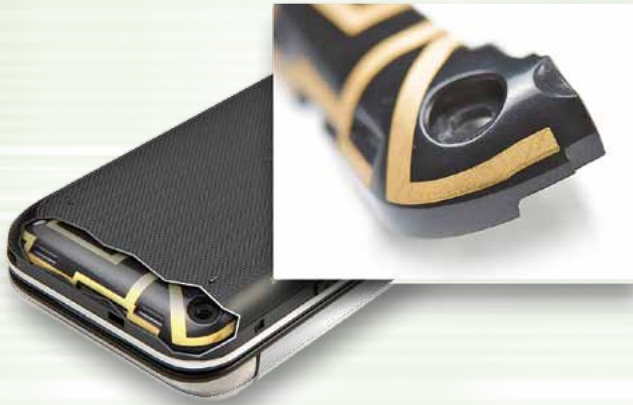
図5 LDSシステムは簡単に既存の部品製造にも適応ができる。

程をなくすことによりさらに高速化と安価な生産工程を実現する。MID技術の利点は多機能を要求されるマーケットでは特に価値が高い。それゆえ現在生産されているMIDの54%は通信システムに使用されている。ついで自動車が17%、医療関連が13%、セキュリティ関連は8%となっており、高い専門性・技術性を要求されるマーケットでよりMIDに対する高い関心があることを示している。