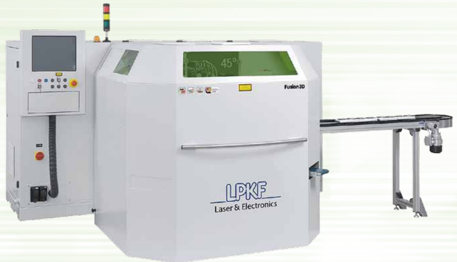
図3 MID成型回路部品レーザ加工装置(LPKF Fusion 3D laser structuring unit)。

すべての生産パラメータは、いつでも使用できる様にシステムによって保存されている。レーザストラクチャーに付属の標準ソフトウェアは、サイクルタイムを最適化するため、それぞれのレーザヘッドに制御データを分配する。ロボットフィーディングシステムと組み合わせる事で、速度と精度、及び高い水準の再現性が保証され、同時に人件