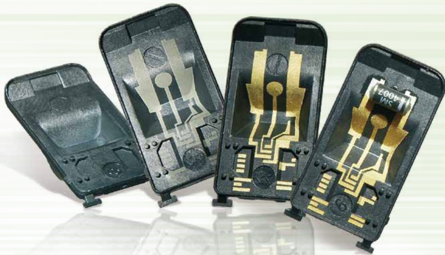
図2 シンプルな射出成形部品から3次元回路キャリアの組み立てまでの3つのステップ。

のあるフィルムを押し付ける様にダイを使用し、余計なフィルムはその後取り除かれる。この方法はシンプルで、広範囲な材料で利用されている。しかし問題はこの方法では高品質トラック、実際の3次元構造、および複雑な回路を作ることができない。2つの部品の射出成形法の動作だが、最初のポリマーは回路のキャリアを製造するために使用。2番目の金属化ポリマーは導電性トラックが配置されている領域だけに適用。この方法は3次元設計に大きな自由度をもたらすが、2つの射出成形用金型が必要とされるためにより高価な方法になってしまう。そのほかトラックの精度にも限界があり、製品化には比較的長い時間が必要となる。そして射出成形金型の開発だけでも、2カ月程度の期間が必要とされる点が課題である。